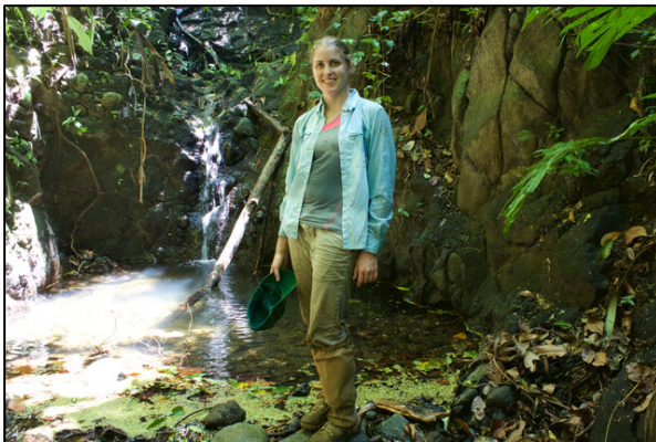
Carina en Costa Rica

¿Por qué las plantas producen estos químicos que son tan útiles para las personas? Una razón es que las plantas no pueden huir o esconderse de los herbívoros , los animales que se alimentan de ellas. En vez de huir, muchas plantas se defienden mediante estos compuestos químicos que pueden ser venenosos o tóxicos para los herbívoros. Como dicen los farmacéuticos, “la dosis hace el veneno” mostrando que en realidad todo depende de la cantidad. Una pequeña cantidad de cafeína te ayuda a estar atento y despierto, pero no te sentirías tan bien si te comieras una ensalada gigante de hojas de café. De manera similar, un herbívoro que coma muchas hojas de la planta del café enfermará y dejará de comerlas. Es por esta razón por la que las plantas han evolucionado para crear estos productos químicos, para evitar su depredación. Con los beneficios que les da no ser depredadas, las plantas sobreviven y se reproducen, cualquier beneficio que obtenemos los humanos no es intencional y es un efecto secundario de la evolución.