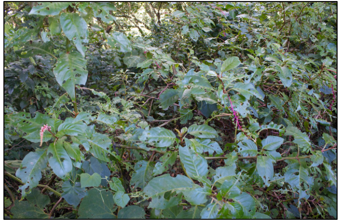
Plantas de Jaboncillo con muestras de herbivoría

Antes de que los científicos aprendieran a elaborar medicinas en el laboratorio, incluso antes de que se les considerase químicos, la gente encontraba sus medicinas en las plantas. Hoy en día, la gente sigue extrayendo productos medicinales de las plantas mientras que otros que solían extraerse de plantas se procesan de manera industrial.