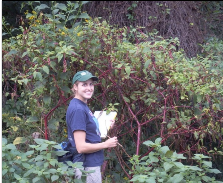
Carina y pokeweed en Tennessee.

Cuando viajas a los lugares cálidos y tropicales, te puedes ver expuesto a un riesgo más grande de enfermedades como malaria, fiebre amarilla, o dengue. Además de los seres humanos, otras especies también pueden encontrar el mismo patrón de riesgo. Por ejemplo, los científicos han notado que los cultivos suelen tener más problemas debido a plagas si crecen en las latitudes bajas (más cercanas al ecuador). Estas ubicaciones en latitudes bajas tienen climas más calientes. No sabemos exactamente por qué hay más plagas en los lugares más cálidos, pero puede ser porque estas plagas no sobrevivan bien a inviernos muy fríos.