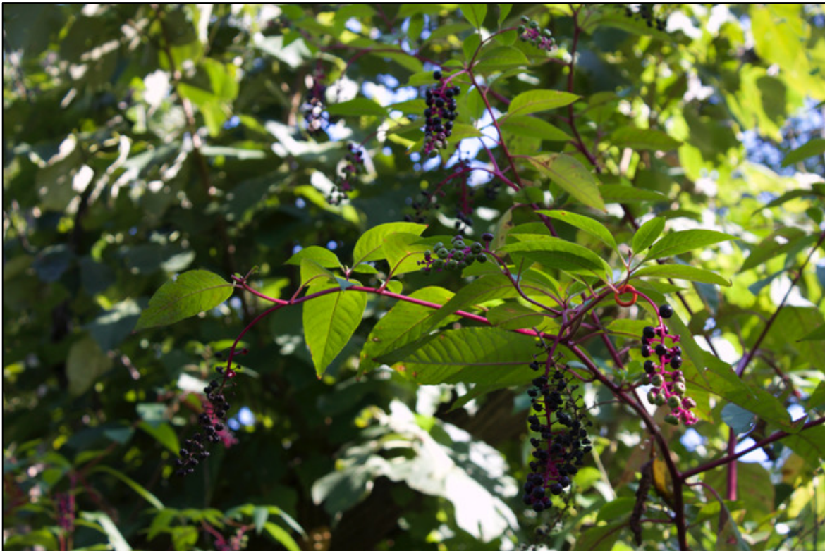
Pokeweed ( Phytolacca americana )

En cada uno de los diez lugares, marcaba cinco hojas muy jóvenes en 30 o 40 plantas. ¡Eso son más de 1,500 hojas! Entonces regresaba seis semanas después para medir el porcentaje de la hoja comida mientras crecían en hojas grandes y maduras. Cuando las hojas son jóvenes, son más tiernas y los herbívoros pueden comerlas fácilmente (por eso comemos ensalada de brotes de espinaca). Para medir la herbivoría, comparaba el área comida respecto al área total de la hoja, y calculaba el porcentaje de la hoja comida por las orugas, los herbívoros principales de la Phytolacca . Entonces promediaba el porcentaje comido de las cinco hojas en cada planta. Algunas plantas se murieron en las seis semanas entre marcar y medir las hojas, así que el tamaño de la muestra variaba entre 4 y 37 en los distintos lugares.