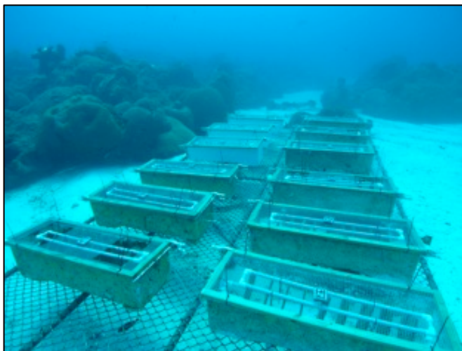
Montaje experimental con las baldosas en los cajones de plástico. Algunos de ellos tienen erizos de mar.