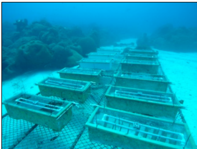
Montaje experimental con las baldosas en los cajones de plástico. Algunos de ellos tienen erizos de mar.